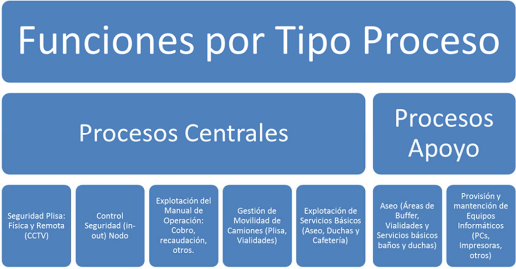
Ilustración 1: Resumen de actividades por Procesos Centrales y de Apoyo.

Los objetivos específicos del proceso de licitación estarán enfocados en: